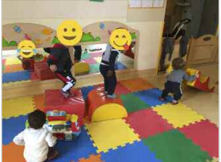
I bambini durante il gioco